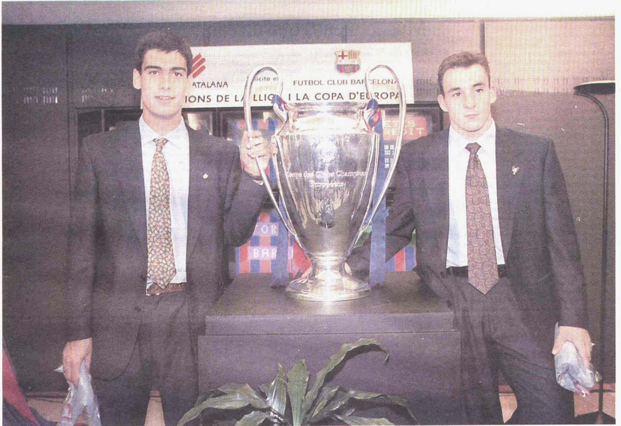
LA PRIMERA COPA DE EUROPA. El Barça ha tardado 37 años en ganar la Copa de Europa; Guardiola y Ferrer lo han hecho en sólo dos temporadas

Guardiola y Ferrer llegan a los Juegos con 21 y 22 años y un 1992 de ensueño