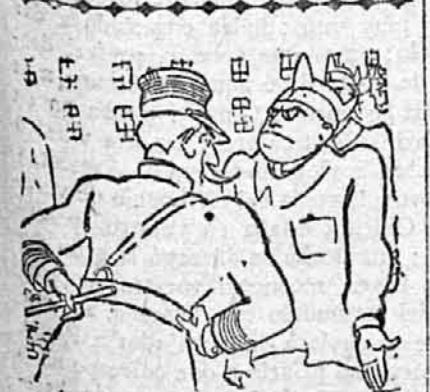
Y tú, muchacho, ¿qué eras antes de ser soldado? —Coronel, mi labrador.

Horas agradabilísimas y de imborrable recuerdo fueron las del jueves en la Casa L. Loscertales para cuantos tuvimos el honor de acudir. Y blason preciadísimo fué para la industria nacional del mueble y decoración el que aquellos señores añadieron a los ya conquistados, abriendo las puertas de aquel magnífico recinto en plena calle de Alcalá, que, como ayer dijimos, nos transportó por breves momentos a los clásicos e inolvidables bulevares parisinos de Sebastopol y Rochecouart, cuyas exposiciones y «magazines» de ricos muebles atraen la atención de cuantos llegan a la Ville Lumière en búsqueda de las más grandes emociones estéticas.—J. R.